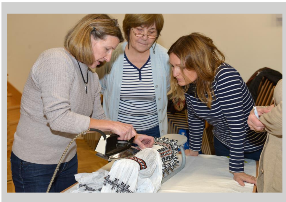
Krojové dílny IV

V prosinci proběhla poslední část oblíbeného vzdělávacího semináře „Krojové dílny“, tentokrát na téma údržba hornáckého kroje, včetně praktické ukázky.