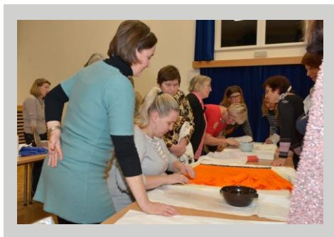
Praktická ukázka údržby kroje

Všem, kdo přišli, a především všem lektorkám moc děkujeme. Těší nás jejich zájem, ochota se podělit o toto umění, a především sdílet cit a lásku k folkloru, bez kterého si život na Hornácku už nedokážeme vůbec představit. Děkujeme!