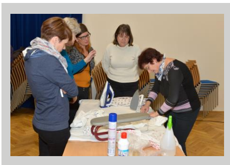
Praktická ukázka údržby kroje