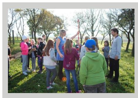
Děti se v Ekocentru učí měřit výšku stromů a poznávat druhy stromů

O výsadbách a dalších vzdělávacích seminářích na téma výsadeb stromů se můžete dozvědět na stránkách svých obcí nebo na stránkách www.hornacko.info .